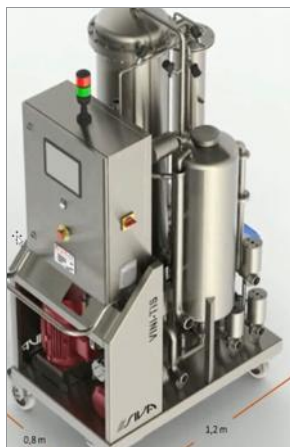
Le concept de filtration TIS® est développé par Siva.

Associé aux membranes céramiques de Tami Industries, ce concept permet de proposer des unités de filtration particulièrement compétitives, performantes et respectueuses du produit. Elles se déclinent en